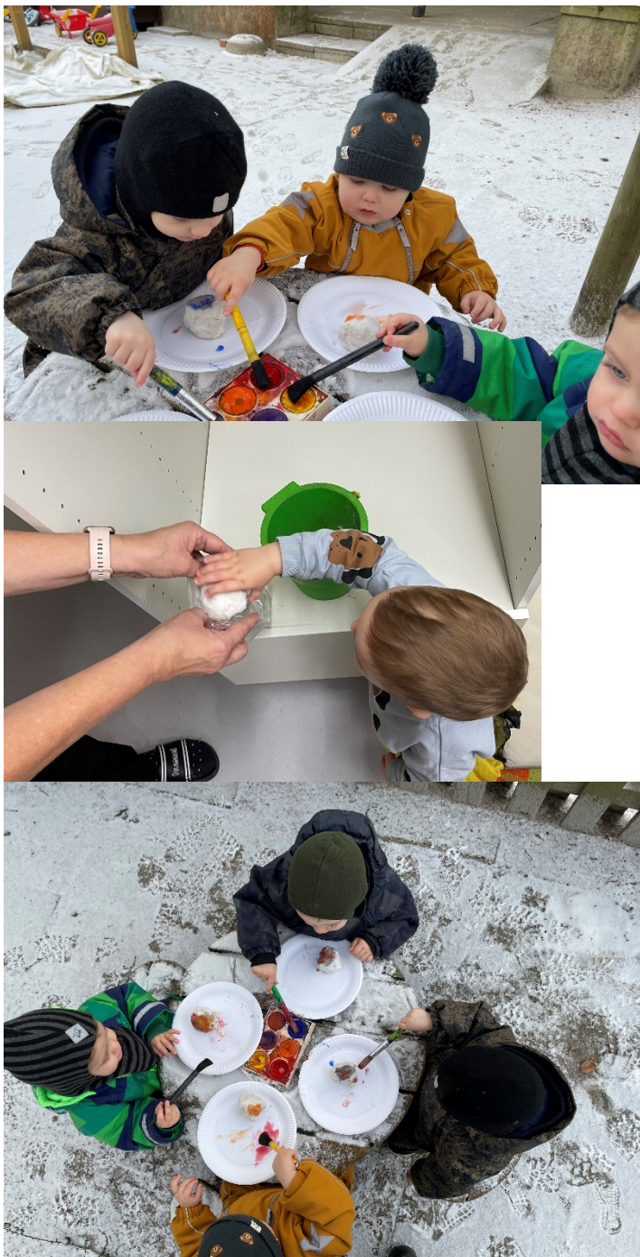
Smittemodel: Fugletema hos søstjerne (5-6 årige)

Der blev lavet en lille udstilling, så børnene kunne se dem fra vores vindue på stuen. Herfra kunne vi følge sneboldene i forhold til hvordan de ville komme til at se ud, når temperaturen udenfor ændre sig.